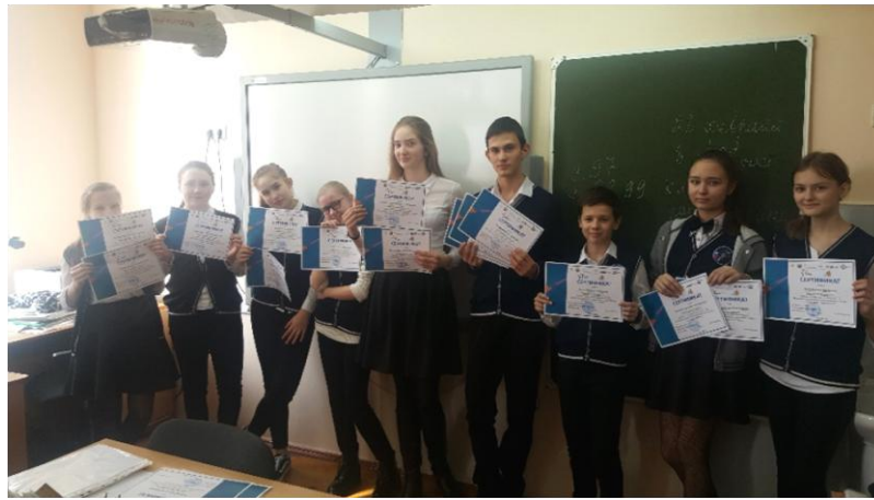
Фото – участники отборочного школьного этапа Всероссийской олимпиады «Звезда» (учащиеся 6А, 7А и 7Б классов)

Дипломы III степени по профилю «русский язык» получили: